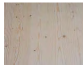
IVI – jakost pohledové strany v průmyslovém prostoru