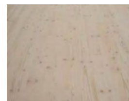
VI – jakost pohledové strany v obytném prostoru